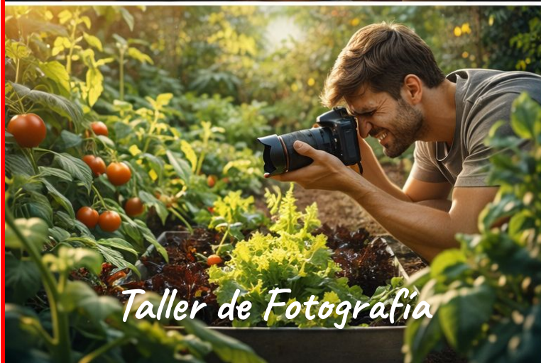
Taller de Fotografía