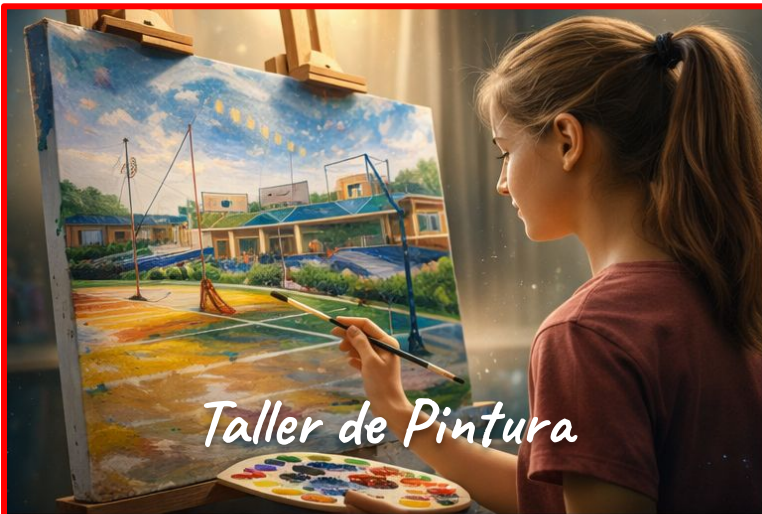
Taller de Pintura