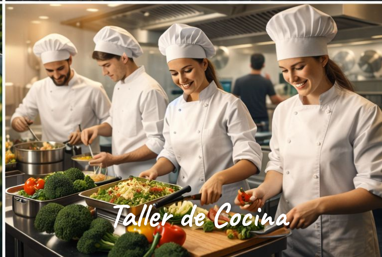
Taller de Cocina